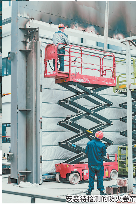
安装待检测的防火卷帘