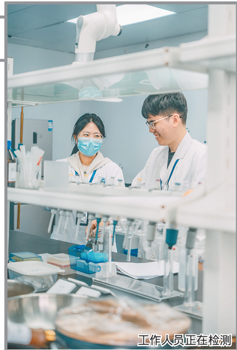
工作人员正在检测