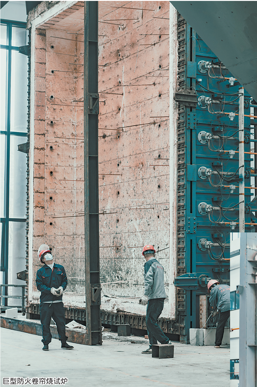
巨型防火卷帘烧试炉