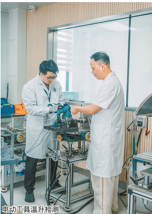
电动工具温升检测