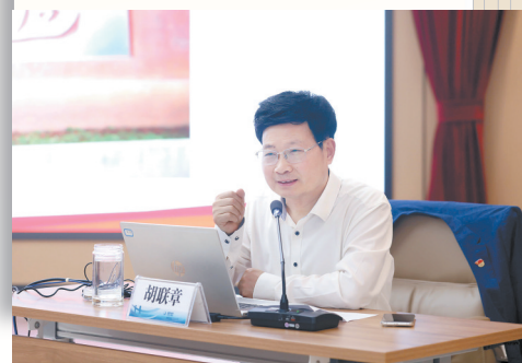
以上图片均为讲座现场