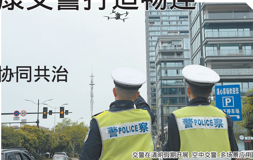
交警在清明假期开展 空中交警 多场景应用

今年以来,市公安局交通管理大队立足实际,聚焦路面管控、秩序整治、宣传教育,依托科技赋能,积极构建“时空地”一体化协同共治模式,全方位打造畅连安行丽州图景。