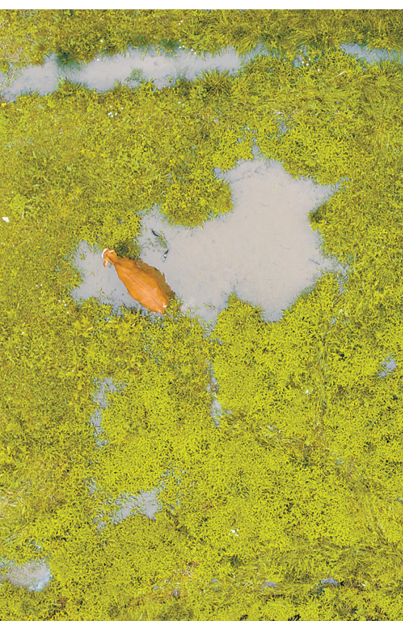
象珠镇山西村附近