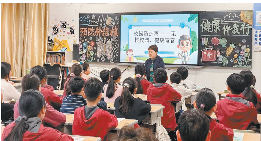
专家入校讲解结核病防控知识

市一医感染性疾病科联合市疾控中心走进社区,为居民讲解老年人、糖尿病患者等高危人群的预防要点,强调早发现、早诊断、早治疗的重要性。该