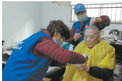
志愿者为老人理发、剪指甲