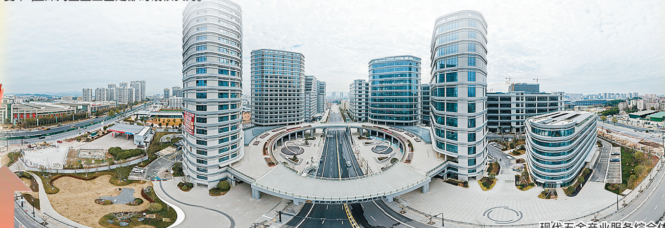
现代五金产业服务综合体