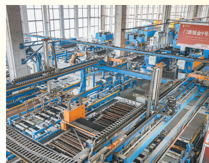
王力公司柔性制造智能化产线

企业创新的“繁星点点”,离不开全市创新生态“阳光雨露”的滋养。我市不断加大科技投入,有效撬动社会资本,形成“双轮驱动”的良好局面。从攻克关键技术的实验室,到生机勃勃的孵化基地,再到覆盖全域的创新政策网络,一个以市场为导向、企业为主体、产学研深度融合的创新体系在我市加速成型。这股澎湃的科创动能,正驱动着新质生产力不断涌现,让“五金之都”的称号,在新时代焕发出更耀眼的光芒。