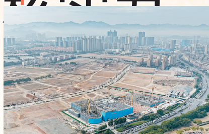
老城区区块低效用地改造