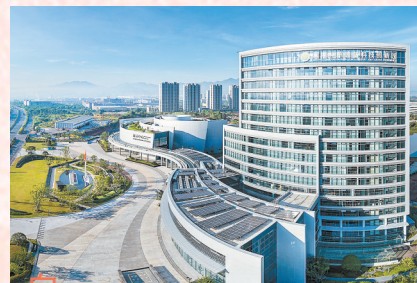
国家林草装备科技创新园