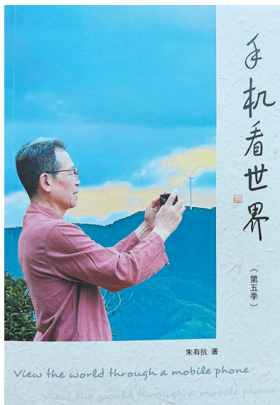
《手机看世界》(第五季)封面

二是内容之丰,扎根泥土,在时代脉搏中萃取精华。翻开书页,扑面而来的,是一个丰富、鲜活、热气腾腾的世界。全书5大篇章,恰如5幅精心绘就的时代长卷,我用5个词来概括:健美永康,洋溢着生命的活力与对健康的追求;名人风采,聚焦各界俊杰,彰显榜样力量;创新发展,记录企业脉搏,镌刻奋斗足迹;家风传扬,深植文化根脉,播撒文