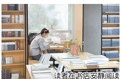
读者在书店安静阅读

阅读习惯改变,也催生了新的阅读空间。当前,许多书店也开始打造沉浸式阅读空间。12月29日,记者在我市新华书店看到,不少读者正倚靠在窗边座椅上看书。