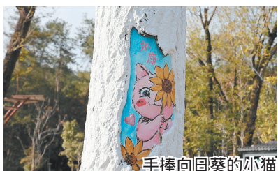
手捧向日葵的小猫

近期,我们对南溪湾公园的部分废旧树洞进行彩绘装饰,同时在香樟公园打造了落叶造景,希望为冬季的公园绿化注入新活力。市综合行政执法局园林管理处相关负责人表示,将进一步发散创新思维,打造“一季一景”的特色景观,让城市景观更灵动、更有新意。同时呼吁市民,在拍照打卡的同时,共同爱护这些创意作品。