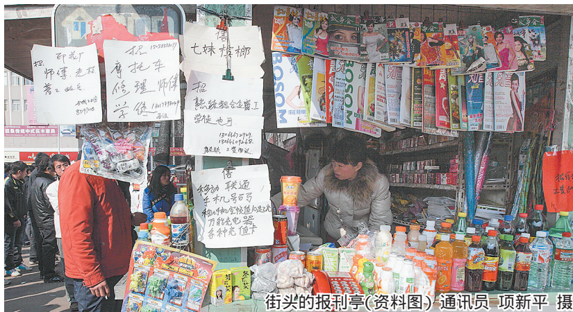
街头的报刊亭(资料图)

虽然以前在报刊亭买过杂志、报纸,但现在看新闻的渠道更丰富也更方便,打开手机就能了解时政大事和一些社会新闻。市民徐珊珊说。