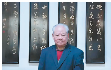
胡世浩先生生活照

胡世浩，少将，1935年5月出生于东阳歌山镇西宅村上宅自然村。90载岁月悠悠，他以忠义家风为根，用热血与担当书写了波澜壮阔的人生篇章，其经历与精神，成为激励后辈的宝贵财富。