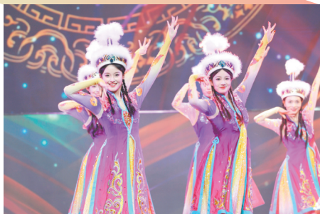
歌舞《新疆是个好地方》