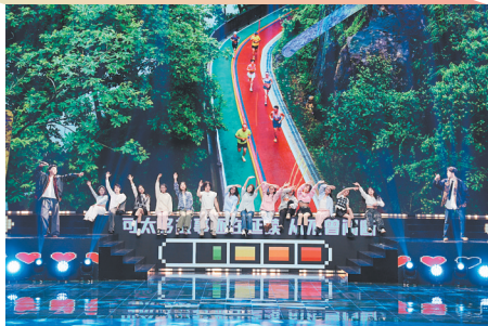
说唱街舞《下班的时候总觉得永康很好看》

1月24日晚,第40届 华溪春潮 春节联欢晚会在广电大剧院盛情上演,为百万新老永康人献上了一场精彩的视听盛宴。