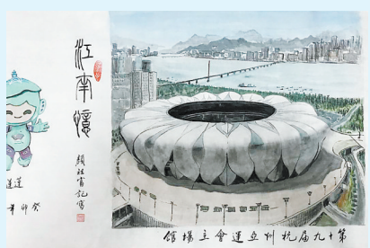
第19届杭州亚运会主场馆