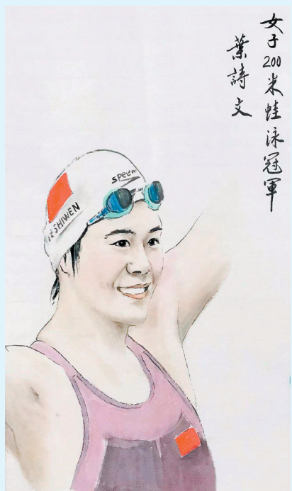
女子200米蛙泳冠军叶诗文