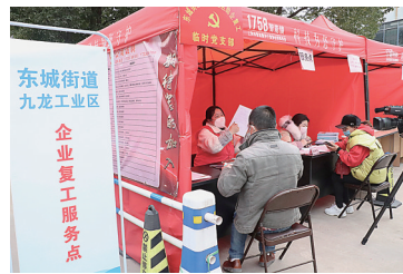
九龙工业功能分区企业复工服务点

前期，街道就已经和水务局（机关助企帮帮团成员）一同开展了走访活动，了解企业当前复工存在的难题，协调处置复工企业与员工、企业与周边群众之间的矛盾，指导、监督企业做好返岗员工的健康监测、筛查工作，严格落实各类防疫措施，确保复工生产安全、人员安全。