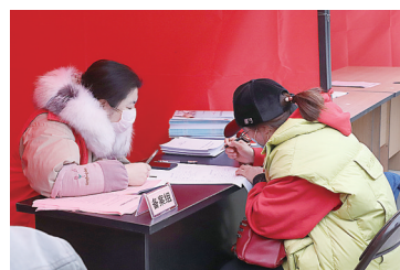
服务点的备案组工作人员为企业带去服务