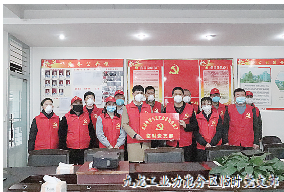
九龙工业功能分区临时党支部