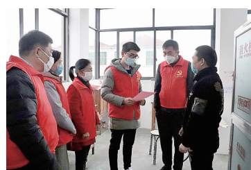
检查组上门核查企业复工筹备情况