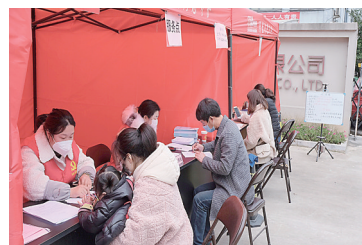
企业负责人在服务点填写材料