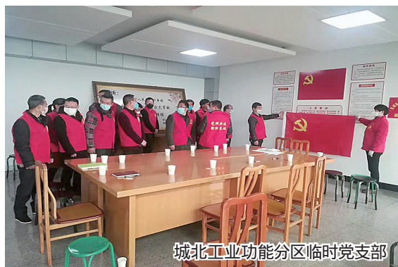
城北工业功能分区临时党支部