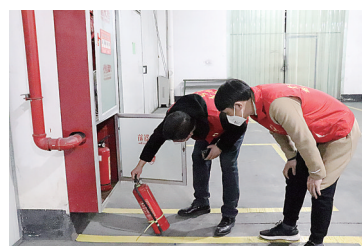
临时党支部成员利用走访机会检查企业安全生产情况