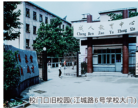
校门口旧校园(江城路6号学校大门)