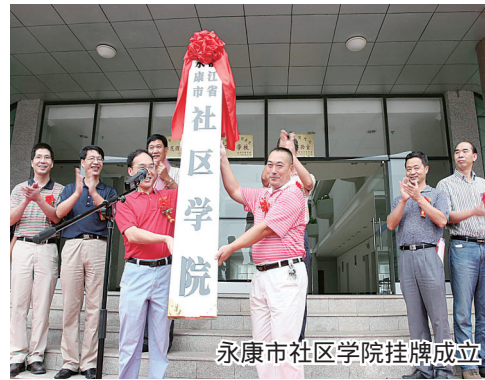
永康市社区学院挂牌成立