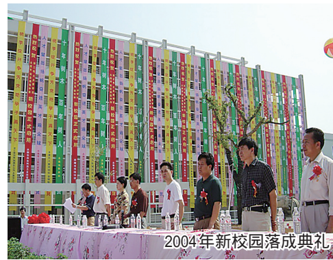
2004年新校园落成典礼