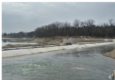
修建中的新三联坝

2日,记者驱车来到距离城区3公里左右的小漓江。原来的三联坝已消失,取而代之的是一座崭新的橡皮坝,工人正在测试进水池。