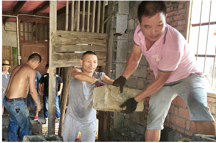
爱心人士正在装修“爱心屋”。

20日,舟山镇溪塘村,一处常年无人居住的老宅里传出了叮叮咚咚的敲墙声。这不是村里闹鬼,而是我市一批爱心人士通过众筹认领了爱心灯,在帮该村的一对穷苦姐妹免费装修新家。