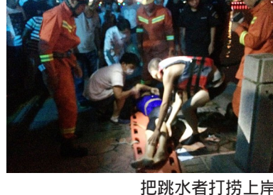
把跳水者打捞上岸