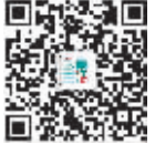
永康生活网公众微信